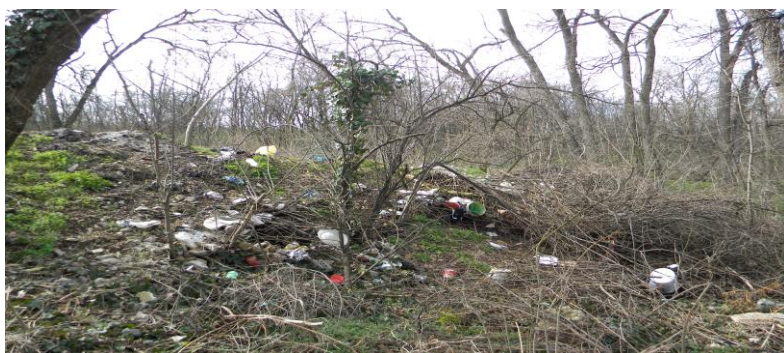
Слика 1. Парк -шумице Бубањ

Уређење парка – шумице Бубањ има за циљ унапређење и очување животне средине, репрезентативнијег изгледа града. За почетак је планирано уклањање дивљих депонија, сеча и уклањања самониклог растинја, болесних и сувих садница по ободу шуме уз улицу Бубањски хероји до “Специјалне школе” и уз улицу Војводе Путника у површини од око 9.250м 2 (дужина улице x 10 м од улице по дубини шуме).