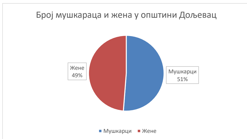
Полна структура становништва

Према подацима Републичког Завода за статистику, у публикацији - Општине и градови 2016.година 3 , а на основу пописа од 2011. године, општина има 18.463 становника, од чега су 9460 (51%) су мушкарци, а 9003 (49%) су жене.