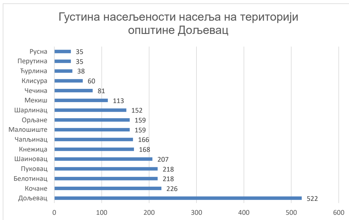
Густина насељености насеља на територији општине Дољевац

Општина се састоји од шеснаест насељених места, која се могу поделити у две групе у зависности од тога да ли се налазе са десне или леве стране Јужне Мораве. Тако су са десне стране Јужне Мораве насеља Белотинац, Чапљинац, Кнежица, Ђурлина, Малошиште, Клисуре, Перутина, Чечина и Русна, док су са леве стране Јужне Мораве Мекиш, Орљане, Шарлинац, Шаиновац, Кочане, Пуковац и Дољевац.