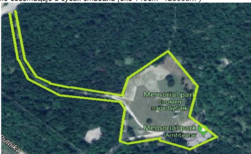
Слика 2: Парк - шума Бубањ - површина на којој су планирани радови на кошењу и чишћењу (Пијететна стаза и око песница 56000m^2 )

Преглед, количина, као и вредност радова дат је у табели: