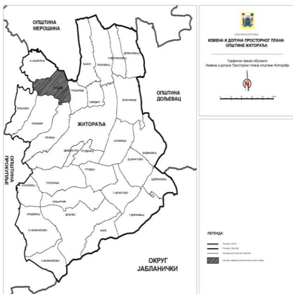
Прилог 1 - Графички приказ обухвата измена и допуна просторног плана општине Житорађа