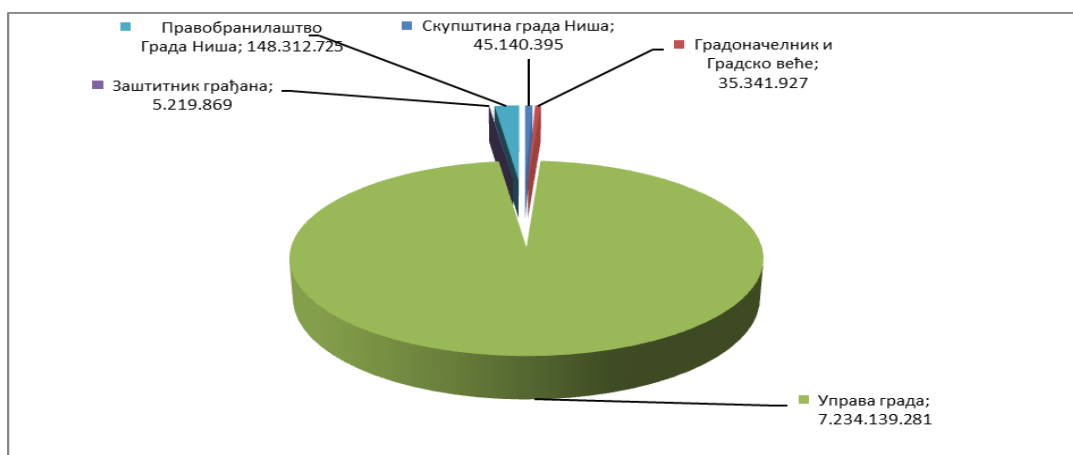
Графички приказ расхода буџета града Ниша по главама