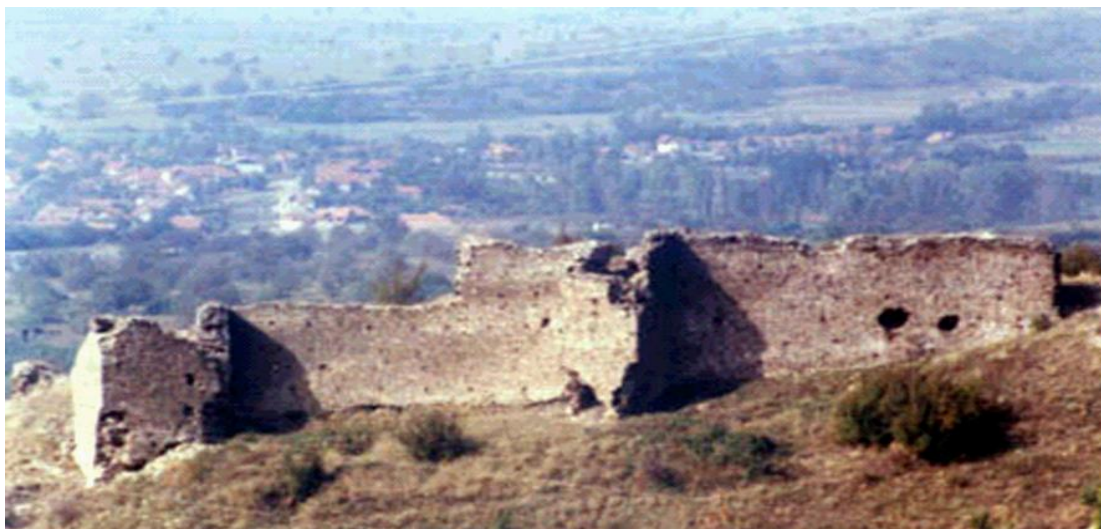
Остаци средњовековног града Копријана

Када је реч о излетничком туризму постоје могућности организовања излетничких тура ка старом археолошком налазишту, средњовековном граду Копријану смештеном на обронцима планине Селичевеце као и посета сркама Светог Симеона која се налази на међи између села Клисуре и Чечина и Светог Јована на Кумиги и посета „шупљем камену“, који се налази недалеко од цркве и коме се од давнина приписују чудотворна и исцелитељска својства.