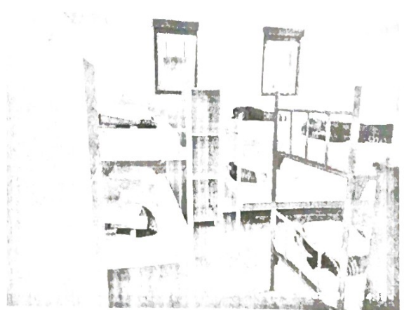
Соба у павиљону за смештај након уређења августа 2021.